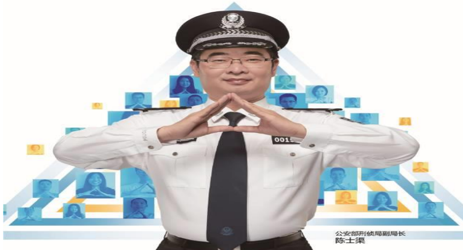
公安部刑侦局副局长 陈士渠