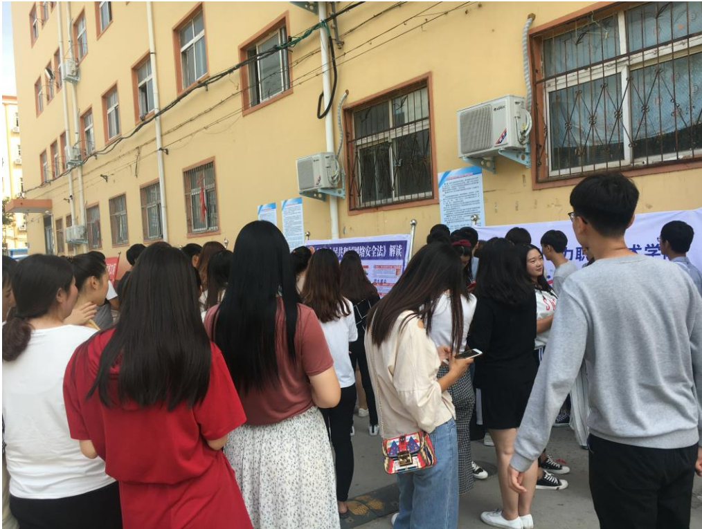
经济管理系学生学习《中华人民共和国网络安全法》