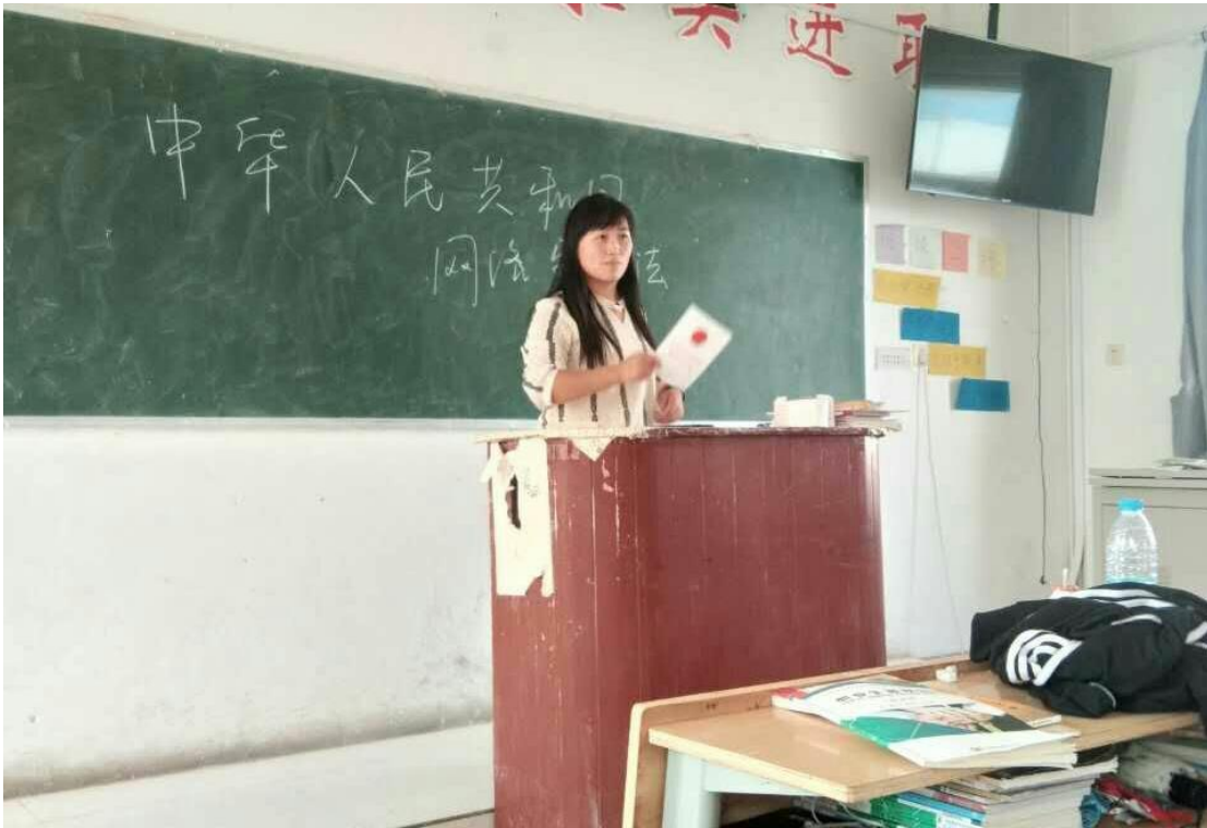
中成部学习《中华人民共和国网络安全法》