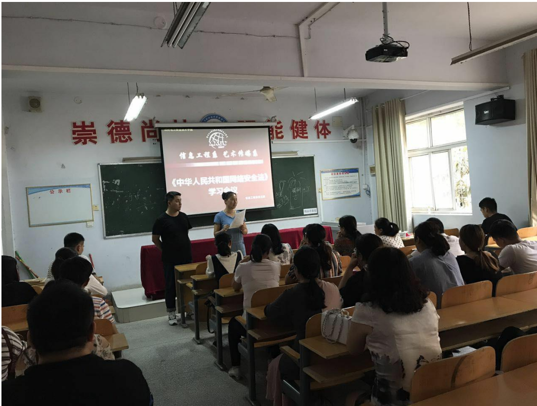
信息工程系和艺术传媒系学习《中华人民共和国网络安全法》