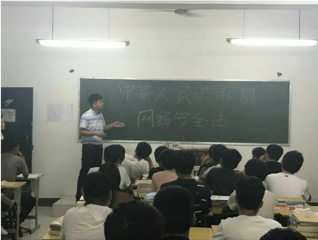
中成部学习《中华人民共和国网络安全法》