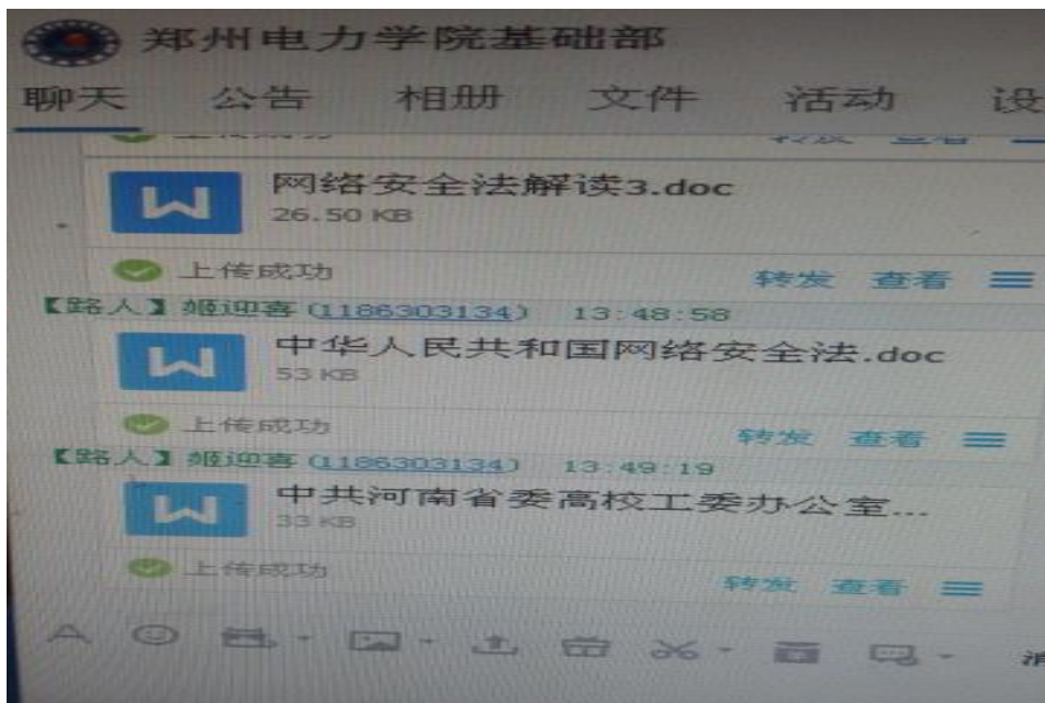
图一：上传学习资料，营造学习氛围