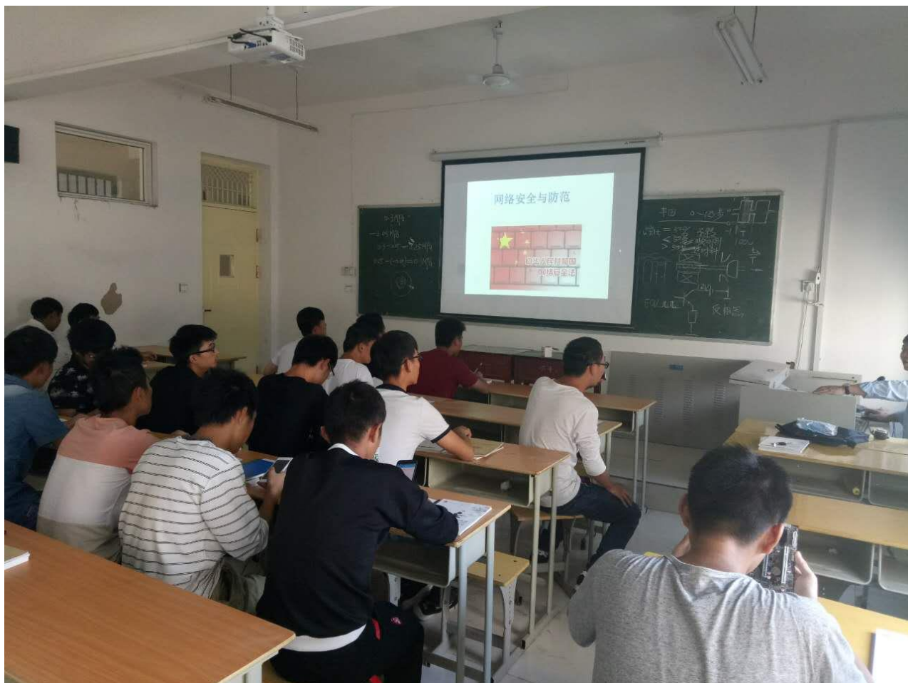
机电工程系学习《中华人民共和国网络安全法》